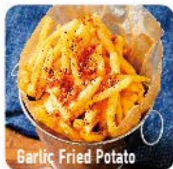
Garlic Fried Potato