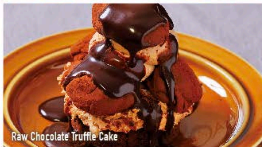
Raw Chocolate Truffle Cake