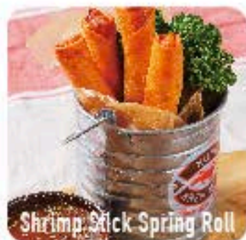
Shrimp Stick Spring Roll