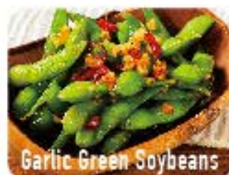
Garlic Green Soybeans