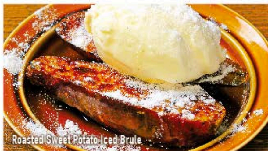
Roasted Sweet Potato Iced Brulee