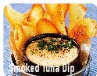
Smoked Tuna Dip